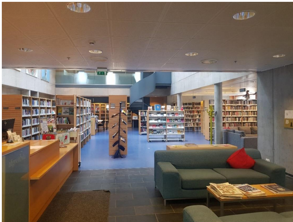
Mynd 5 Bókasafn Austur-Skaftafellssýslu

Bókasafn Austur-Skaftafellssýslu sem jafnframt er bókasafn Framhaldsskólans í Austur-Skaftafellssýslu er á neðstu hæð í Nýheimum. Bókasafnið er rúmgott og vel búið bókum og þar vinnur bókasafnsfræðingur sem veitir nemendum og kennurum skólans þjónustu. Þetta er skýrt dæmi um hagkvæmni þess að hafa skóla og þekkingar- og menningarsetur í sama húsnæði, Nýheimum. Bókasafnið sér einnig um bóksölu námsbóka því engin bókabúð er á Höfn. Nemendur í rýnihópi kvörtuðu yfir háu bókaverði og kalla eftir skiptibókamarkaði á námsbókum.