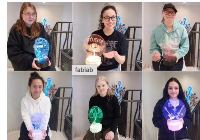
FabLAB og stelpur vinnusmiðja

Menntunar- og rannsóknarverkefni eru sem stendur eru þrjú: PEAK - New Heights for Youth Entrepreneurship, Erasmus+ samstarfsverkefni á sviði starfsmenntunar (KA205). Þátttökulönd eru sex, skólar og aðrar stofnanir: Skotland – verkefnastjórar, Írland, Norður Írland, Grikkland, Ítalía og Ísland.